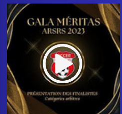
LE CSB EN FORCE

Découvrez la liste des membres du CSB nommés au Gala Méritas 2023